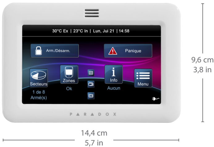
TM50: Écran tactile intuitif